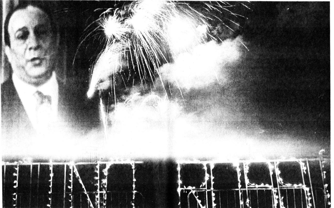
Splendide final Tino Rossi sur l'écran et son nom en lettres de feu.