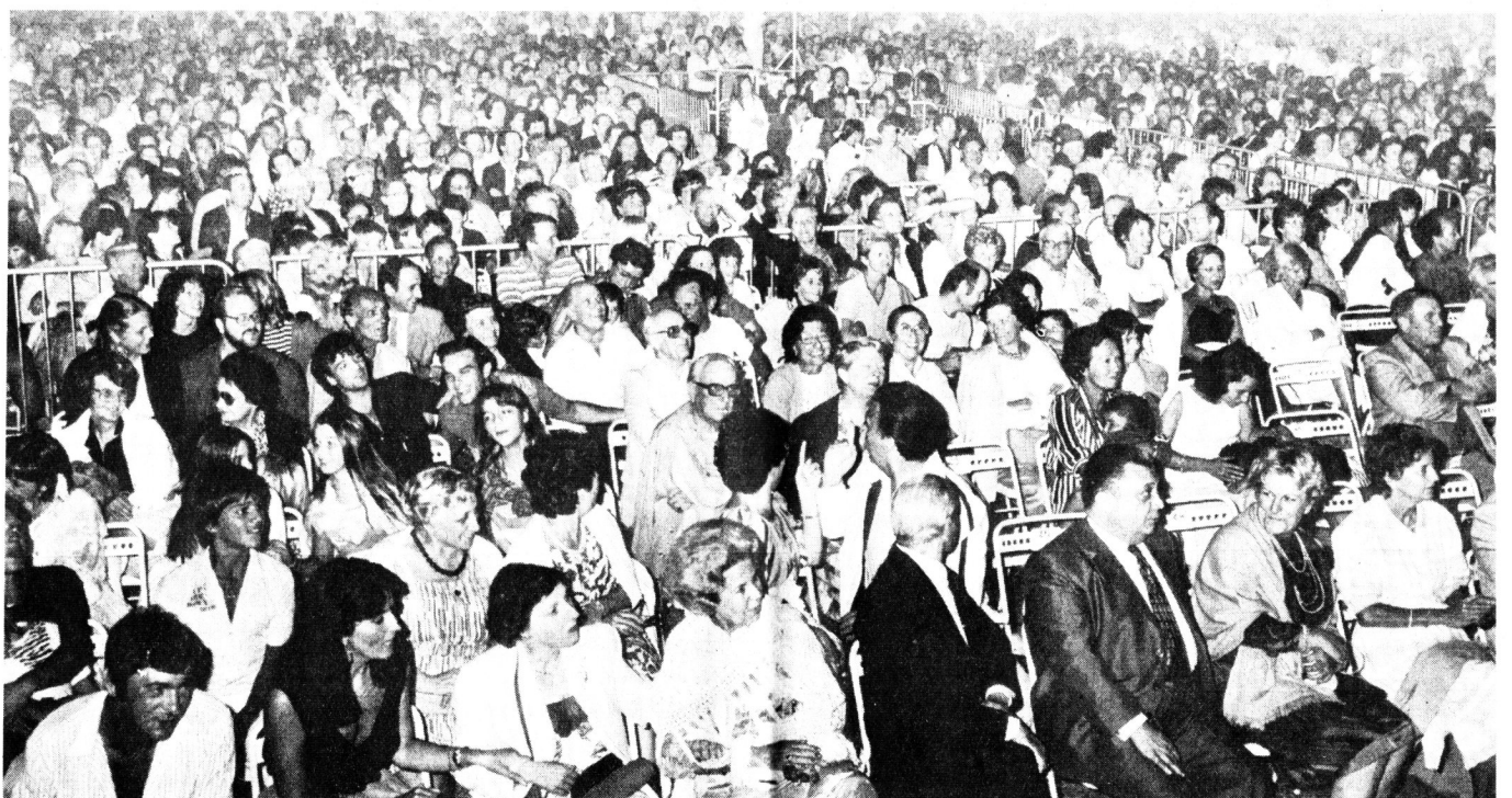
Une immense foule a assisté à cette belle soirée.