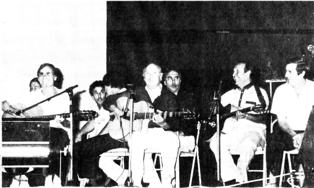
Les artistes du « Pavillon Bleu » et...