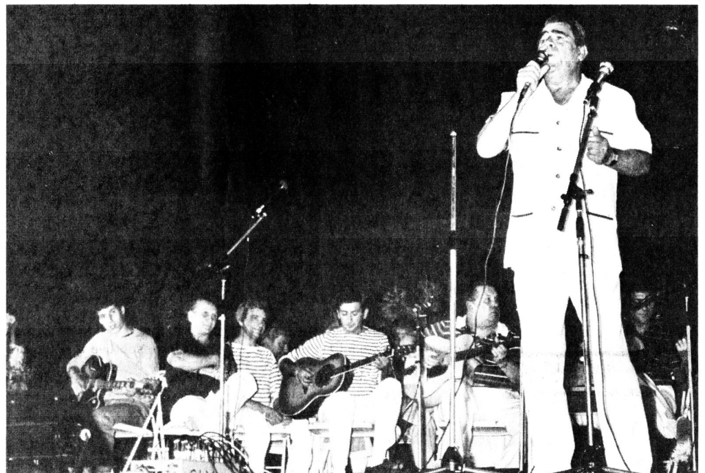
... ceux du « Son des Guitares » étaient là.