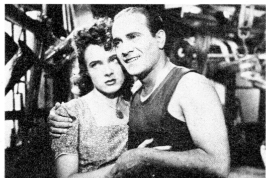
Les plus jolies femmes rêvent de le conquérir, il tient dans ses bras toutes les stars comme Micheline Presle dans « Le soleil a toujours raison », de P. Billon.