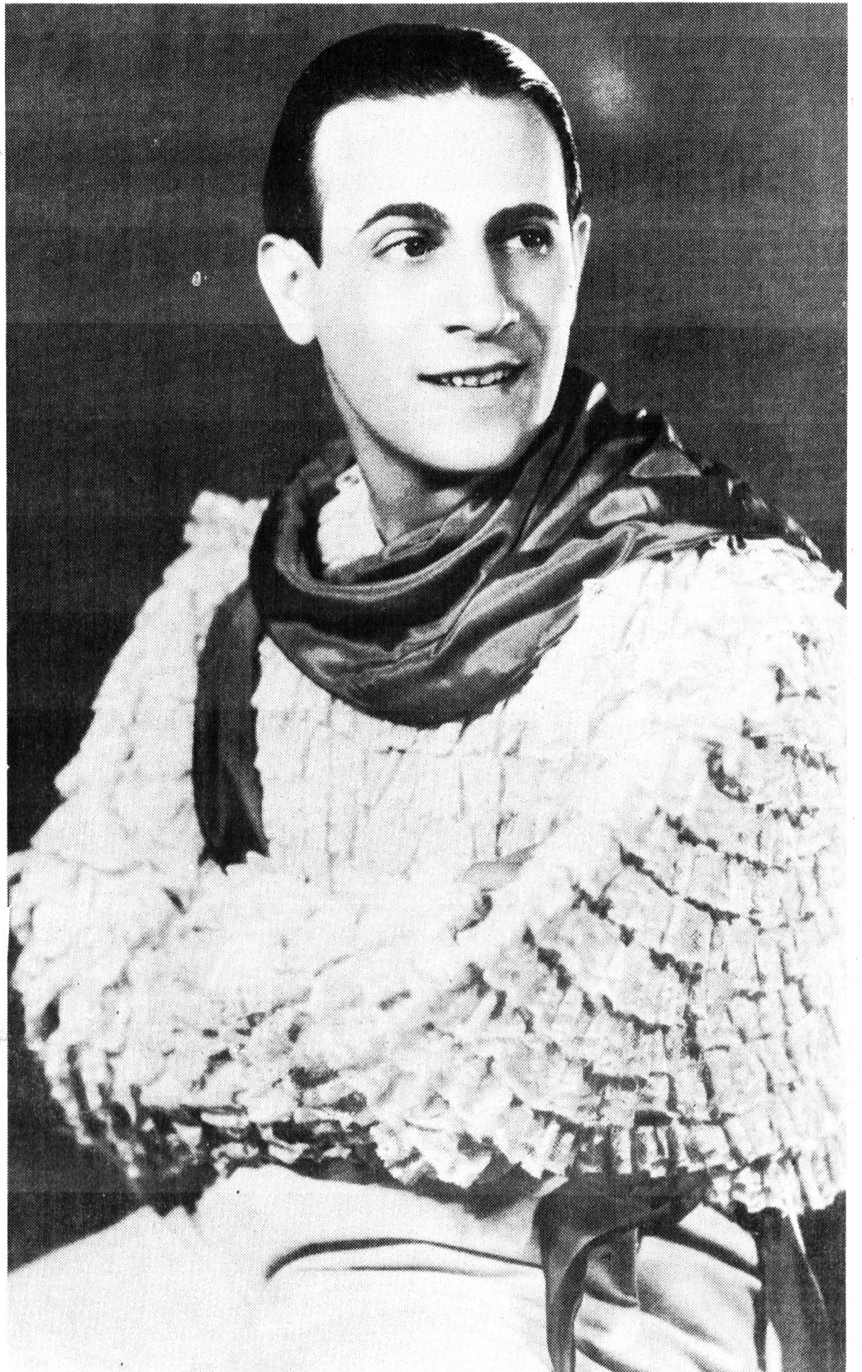
C'était en 1936 : casque de cheveux noirs, sourcils parfaitement dessinés sur un regard de velours, Tino chante un de ses plus grands succès : « Marinella ».