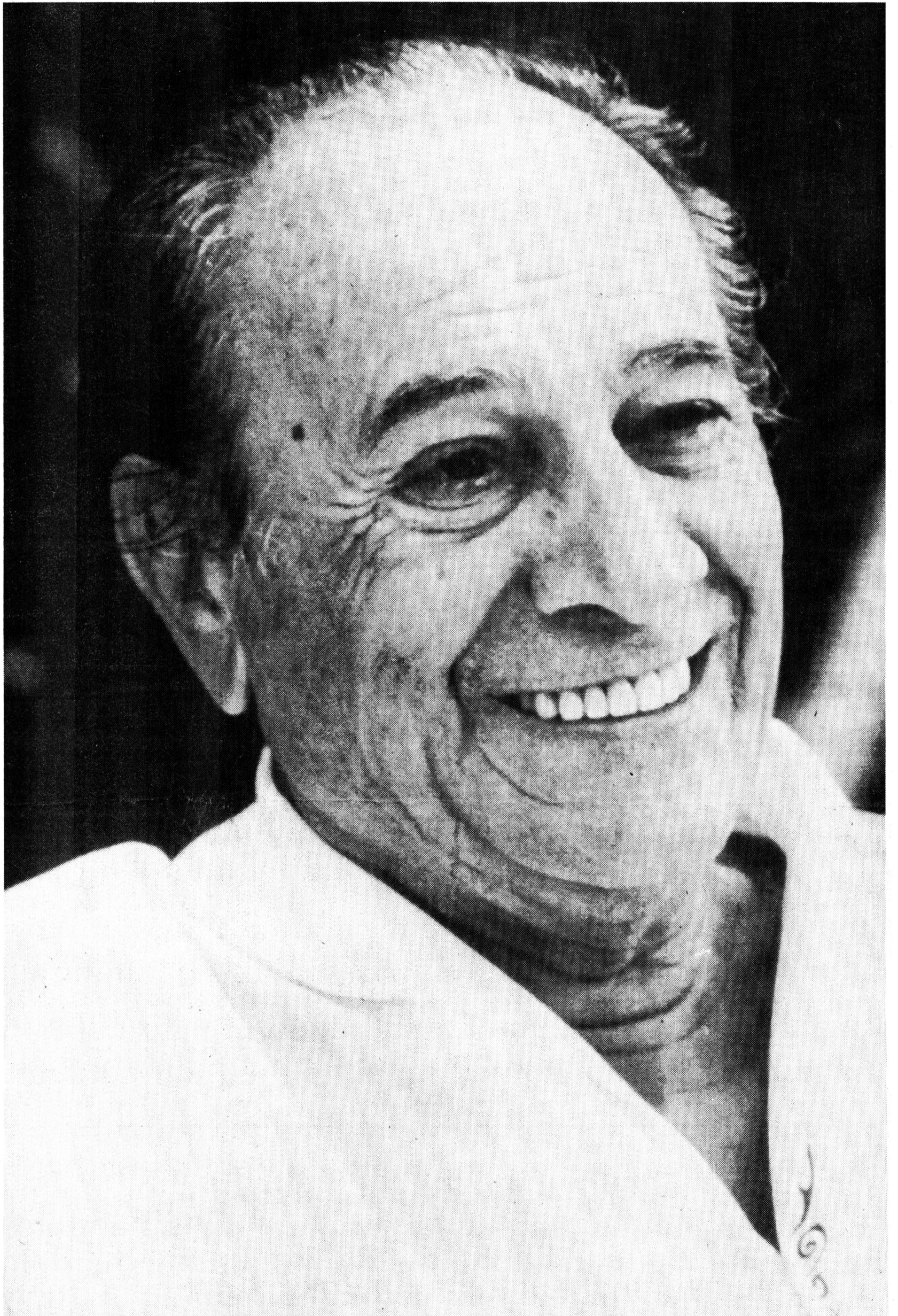
Sa dernière photo en public : Tino Rossi est malade. Très gravement. Il espère, il lutte. Il sourit, comme toujours, confiant malgré tout. Il aime tant la vie.