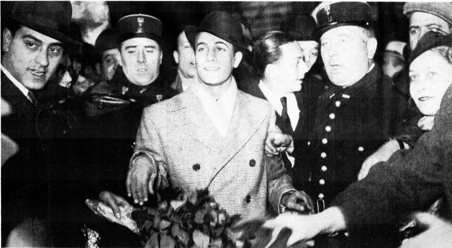
Tino Rossi n'avait pas que des admiratrices. La preuve : les admirateurs qui sont venus l'accompagner en 1937, lorsqu'il prend le train gare Saint-Lazare pour aller s'embarquer au Havre vers les Etats-Unis.