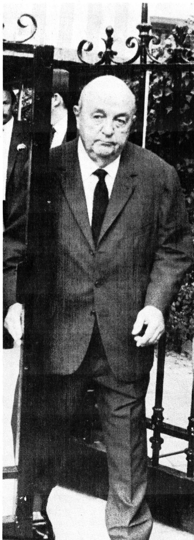
Dernière rencontre, et une grande tristesse : Bernard Blier, prestigieuse carrière de cinéma, ne reverra plus Tino Rossi, fabuleuse carrière de la chanson.

« C'est grâce à lui que j'ai débuté. Je me rappelle très bien lorsque, à dix-sept ans, il m'a invité à sa table pour me dire combien il appréciait mes chansons. Il m'a épaulé et c'est un peu grâce à lui que je dois de chanter. »