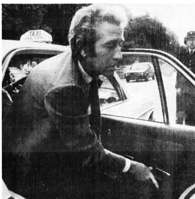
Jacques Chazot a toujours dansé comme Tino a toujours chanté : avec sincérité, avec amour de son métier. C'était l'une des raisons de leur amitié.