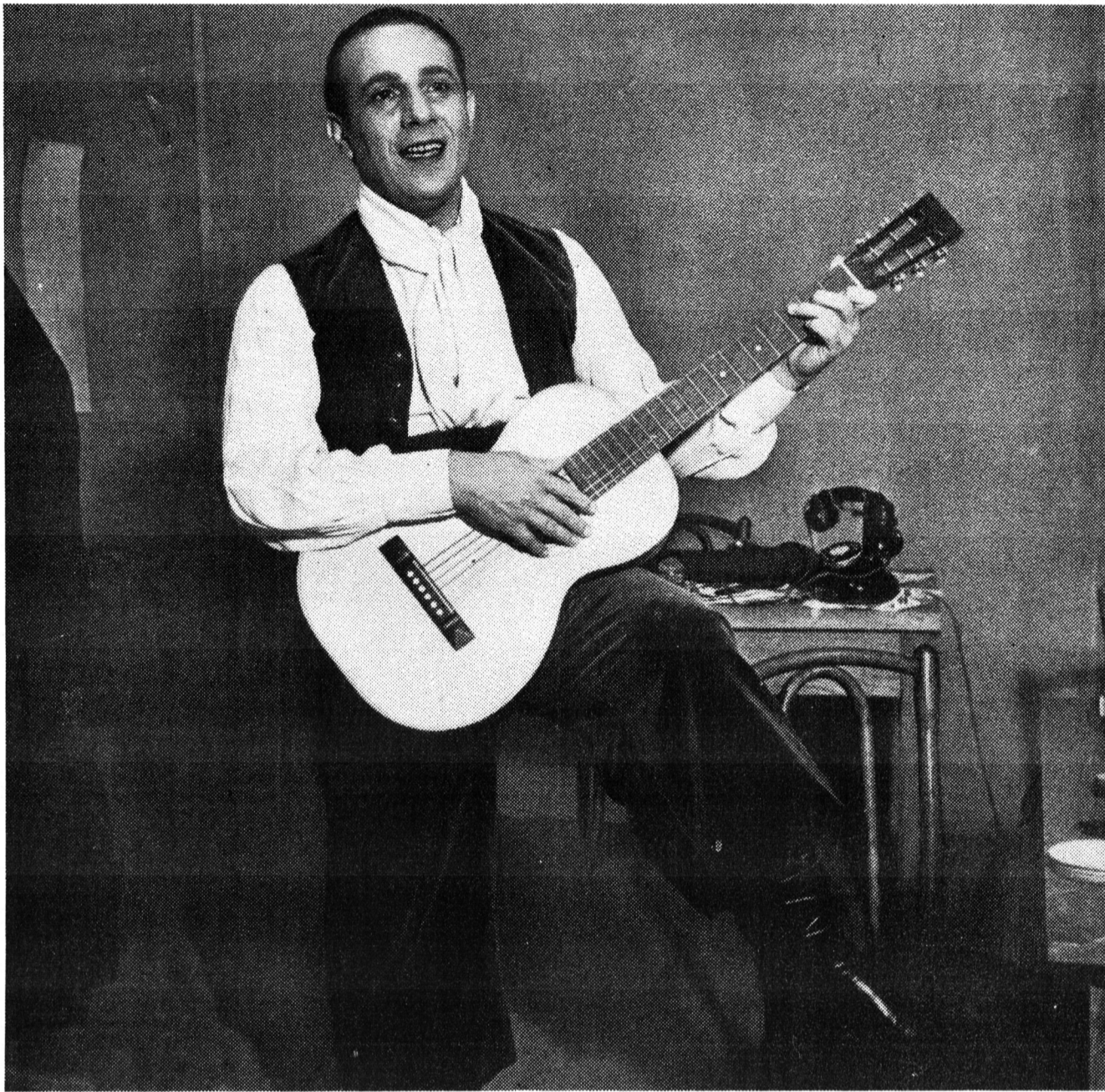
Une guitare, un foulard : c'est le Tino éternel, de films en chansons, et peu importe le costume puisqu'il a toujours la même voix suave et charmante de parfait « tenorino ».