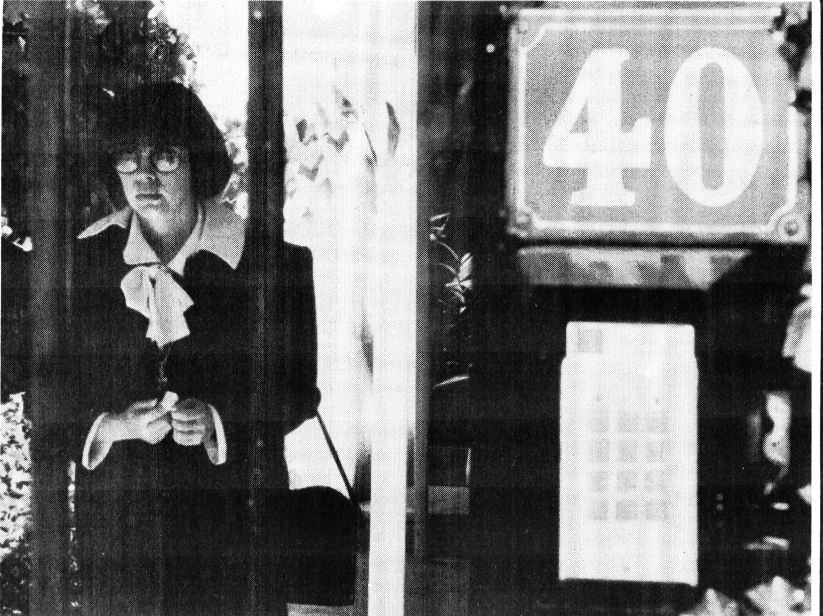
Un peu voûtée, la bouche tirée, les yeux gonflés, Mireille Mathieu sort du domicile de Tino Rossi : elle vient de lui dire adieu.

Je suis sûre qu'aujourd'hui il ne voudrait pas que je pleure (quoique j'ai beaucoup de mal à m'en empêcher...). Car il m'avait dit, et je ne l'oublierai jamais : « Il faut chanter le soleil et l'amour : c'est tu pusses faire aux autres. C'est de cela dont les gens ont le plus besoin. »