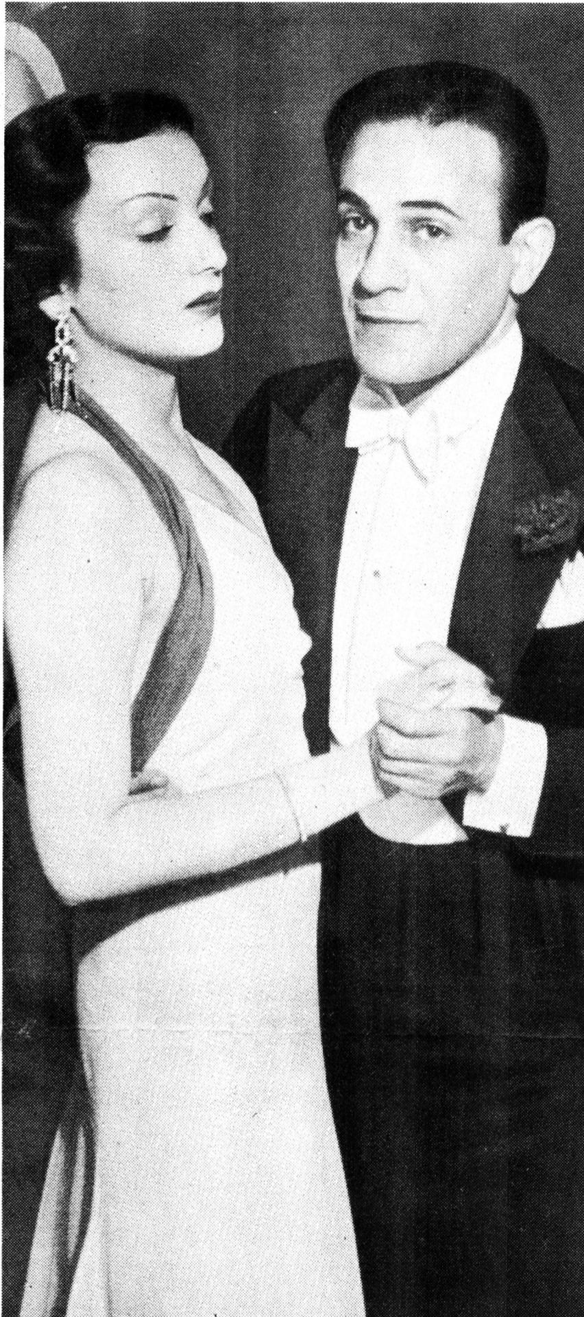
Vie privée : Tino Rossi a rencontré Mireille Balin, l'une des plus séduisantes comédiennes de son époque. Vie professionnelle : ils tournent « Naples au baiser de feu ».