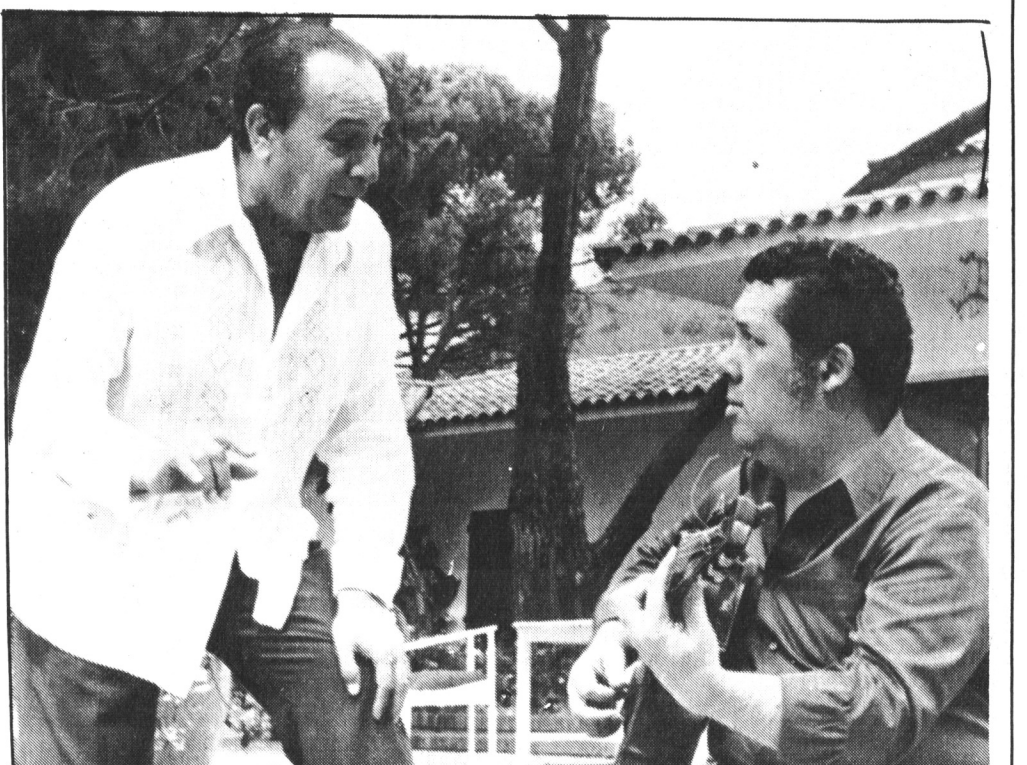
● C'était en 1969. Avant de s'approprier à jouer à l'écran dans «l'Ane de Sigliara» Tino Rossi était venu se reposer dans sa propriété ajaccienne baptisée «Marinella».