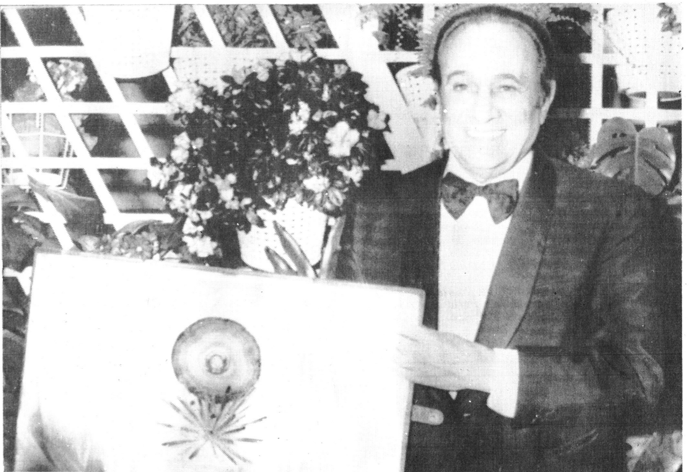
En janvier 1973, Tino Rossi recevait des mains de Robert Manuel, le trophée international du « Show business ».