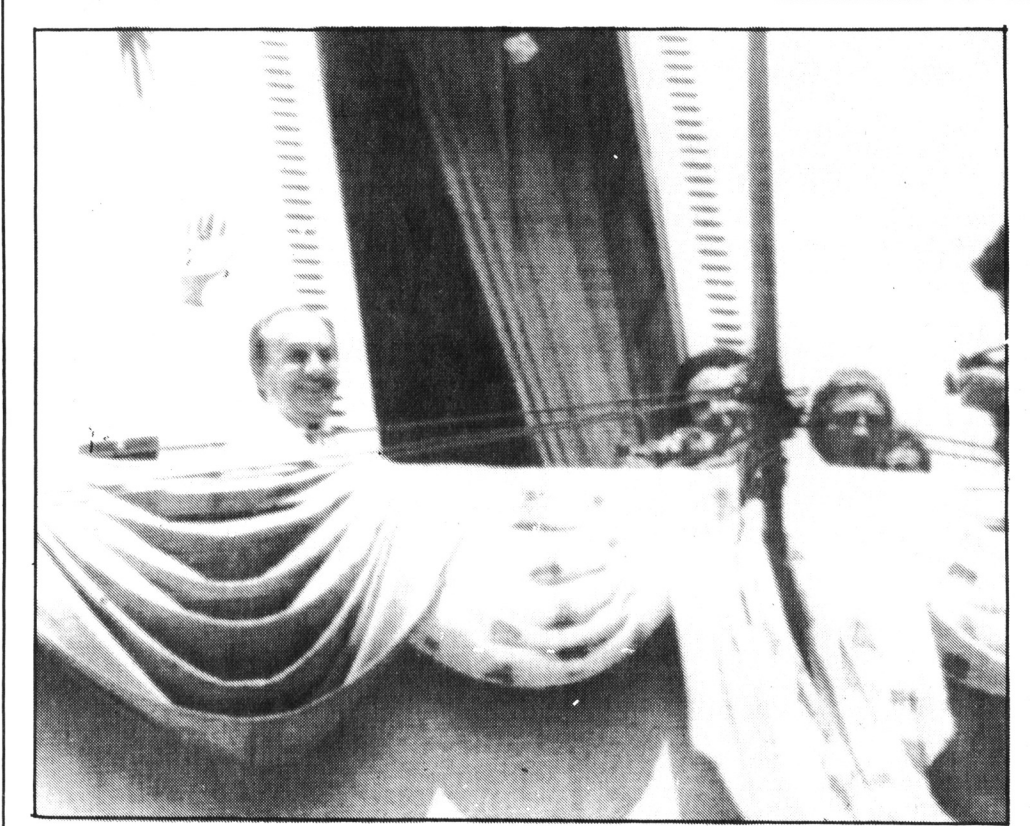
En août 1973, Tino Rossi au balcon de l'hôtel de ville d'Ajaccio, salue ses compatriotes après l'inauguration de l'avenue qui porte son nom.