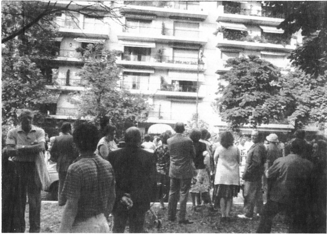
Dans l'après-midi d'hier, les curieux et les amis se pressaient devant la maison du chanteur, avenue Maillot à Neuilly.