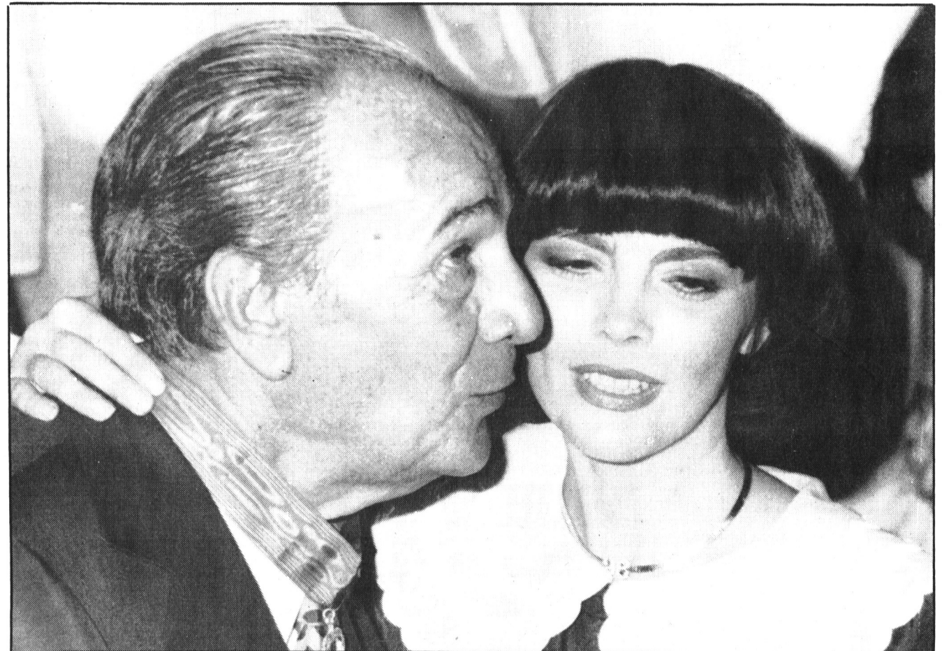
Mireille Mathieu avait une grande admiration pour Tino Rossi. Elle a été bouleversée par la mort de son ami.

L'année dernière encore, au cours d'un de ses nombreux séjours au « Scudo », Tino Rossi, interrogé sur la mort, avait répondu, lui aussi en regardant la mer : « Je vis comme tout le monde. La mort, bien sûr, j'y pense. Mais lorsque je me lève et que je vois ce golfe d'Ajaccio, je ne peux plus penser à la mort ».