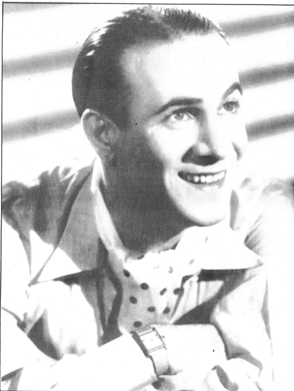
● Tino connu à l'écran le même succès que sur la scène des music-halls. Il restera le modèle du jeune premier méditerranéen à l'œil de velours, à la coiffure gominée.

Une de ses dernières apparitions date de 1953 dans «Si Versailles m'était conté» où, déjà bedonnant, il incarne le gondolier de Louis XIV.