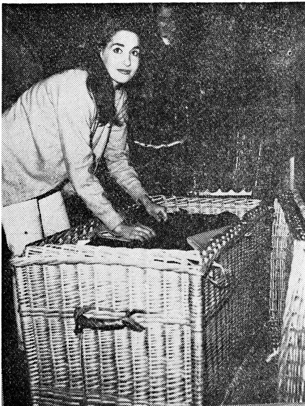
Jacqueline Boyer est une comédienne de grande classe et une merveilleuse chanteuse. C'est aussi une excellente camarade et nous la surpréons ici « mettant la main à la pâte » et aidant à emballer les costumes.