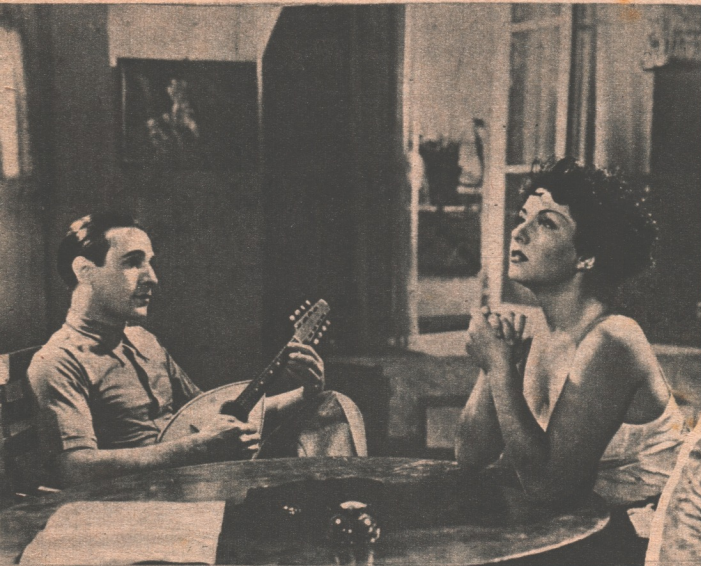
Le quatrième film de Tino Rossi, « Naples ou bûcher de feu », avec Viviane Romance.

plus aux mêmes conditions que la fois précédente. Je parus sur la scène du boulevard Bonne-Nouvelle tel que j'avais paru dans la revue du Casino de Paris, dans un décor évoquant ma Corse natale, entouré de guitaristes et vêtu d'un costume de paysan corse avec la culotte de velours, la chemise de couleur et la veste posée sur l'épaule. J'étais mieux adapté au cadre, mon jeu était devenu plus sobre et je me sentais plus à l'aise sous les projecteurs.