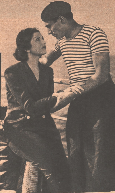
Tino Rossi et Nita Raya dans une scène du film « Au Son des Guitares ».