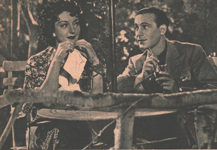
« Naples au baiser de feu », le film qui fait date dans la carrière de Tino Rossi. Il y rencontra deux grandes partenaires : Viviane Romance...