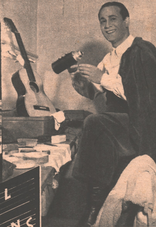
« Et buvons-en un avant les trois coups ! », semble dire Tino Rossi.

Pour un artiste qui, chaque soir, chaque nuit, paraît une ou plusieurs fois en public le réveil est un moment pénible.