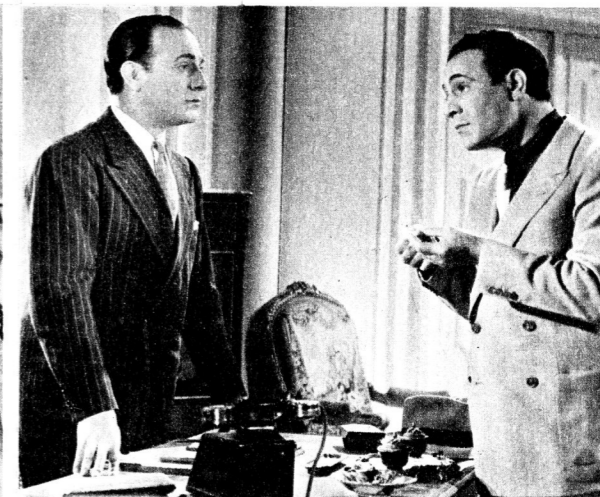
Les deux rôles de Tino Rossi : André Cartier (à g.) et Fred Monetti.