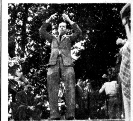
Plus de chaleur! Y a d'l'amour!