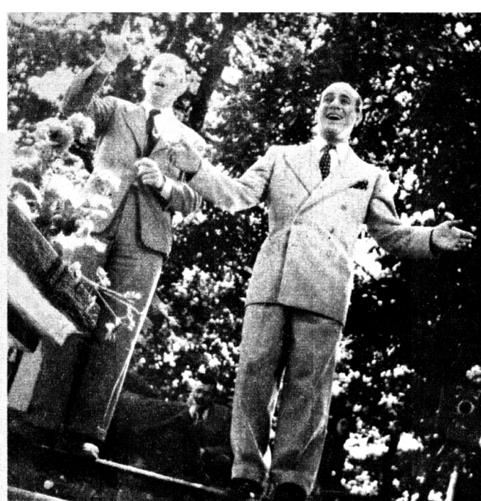
Pour qui chanter cette chanson? "A deux pas de mon cœur".