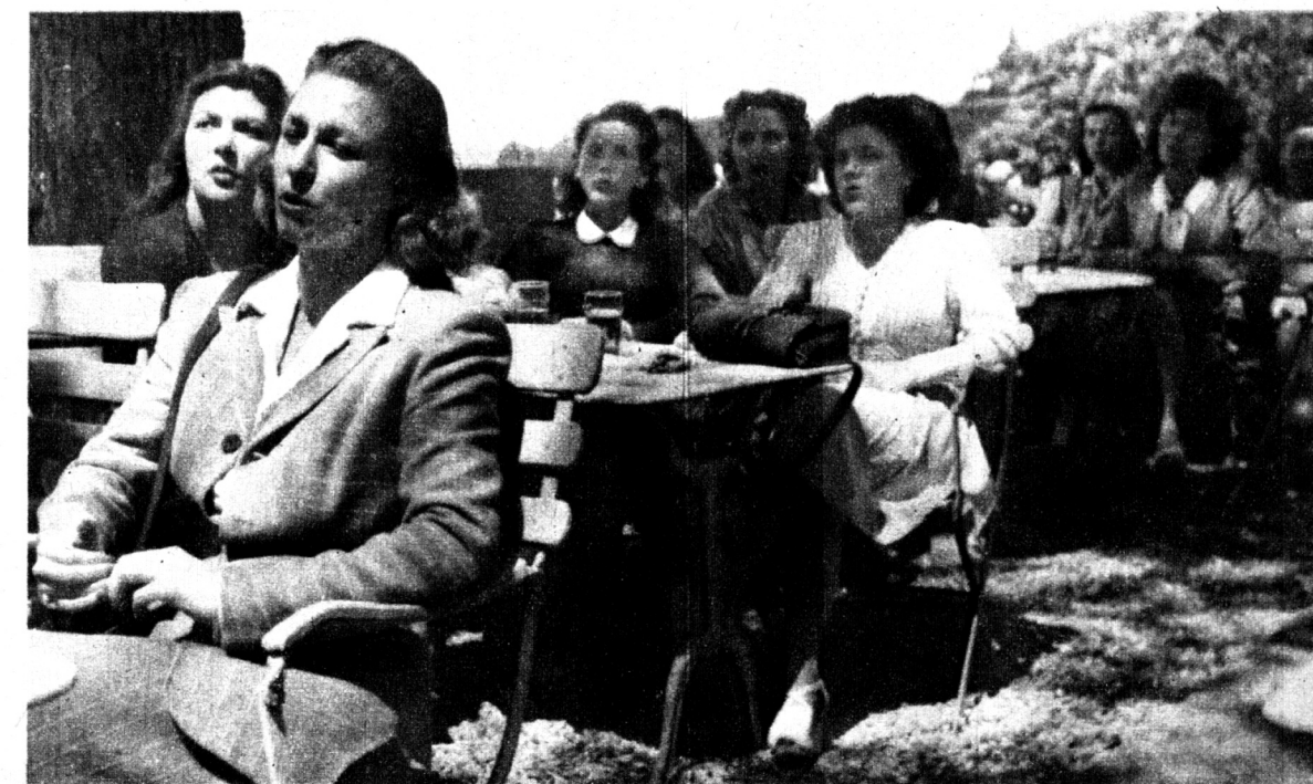
Les midinettes, fées de la couture, sont en extase: Tino Rossi chante pour elles, et pour elles seules.

Qu'il est beau et chante bien... se chuchotent midinettes et figurantes.