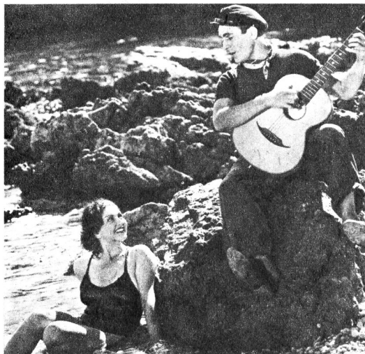
La jolie Suzanne (Nita Raya) a quitté ses amis pour rejoindre, sur son rocher, Jeannot, le joueur de guitare (Tino Rossi).

Télé 7 Jours et Centrale catholique : pour adultes.